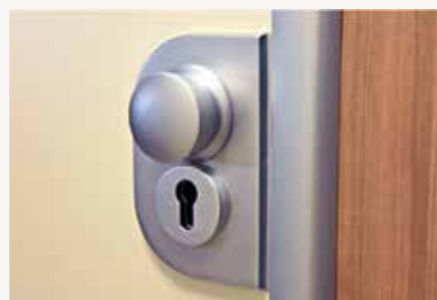
Schlosskasten mit Festknopf, PZ-Rosetten