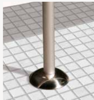
Alu-Aufschraubfuß mit Rosette aus Edelstahl