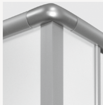
Kopfprofil 74/40/30/13 mit Eckschiene

Unterschiedliche Beschläge und verschiedenes Zubehör ist ebenfalls lieferbar.