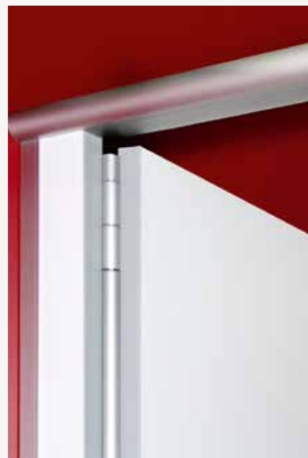
Fingeklemmschutzprofil I, selbstschließend gegen Mehrpreis