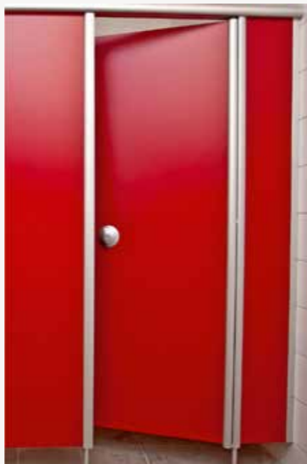
Modell KV mit Einwärtstüren

aus HPL-Kompaktplatte 13 mm. Ecken und Kanten abgerundet, die Pendeltüren haben Fingerklemmschutz und sind mit hohen oder niedrigen Türen lieferbar.