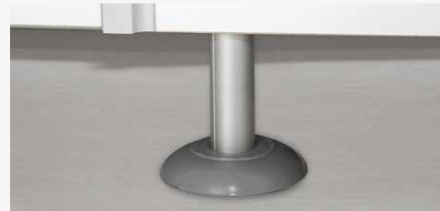
Stützfuß mit Bodenrosetten