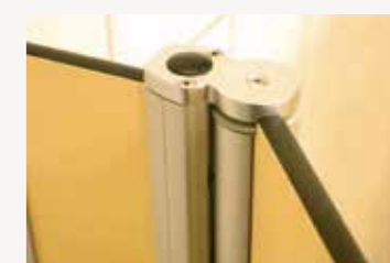
Fingerklemmschutz durch spezielle Gelenke und Gummidichtungen