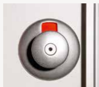
DOMO-Conic Einhandbeschlag – besetzt