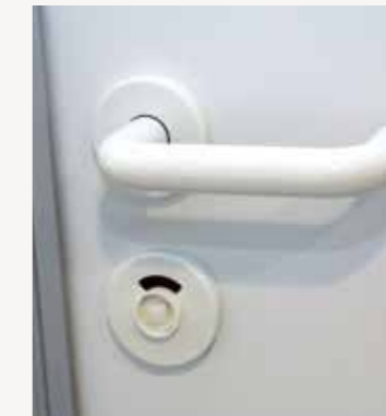
Drücker Nylon außen

Umlaufend mit grauer ABS-Kante, Ecken und Kanten leicht abgerundet.