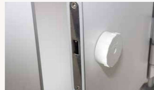
Nylon-Drehknopf mit KA Riegelschloss