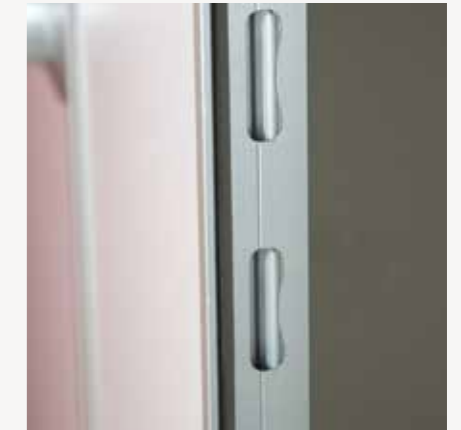
Schließholm - Stanzung für Falle + Riegel