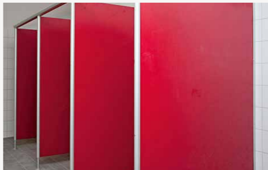
Die Modelle KV1 und KV2 sind durch ihre robuste Ausführung besonders für Nassräume geeignet

Wände aus HPL-Kompaktplatten, Ecken und Kanten abgerundet, verschiedene Beschläge lieferbar, sowie umfangreiches Zubehör.