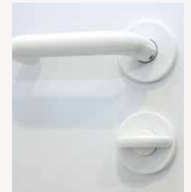
Drücker Nylon innen