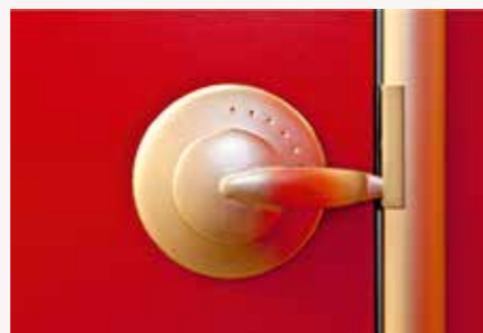
Benutzerfreundlicher Verriegelungshebel, innen