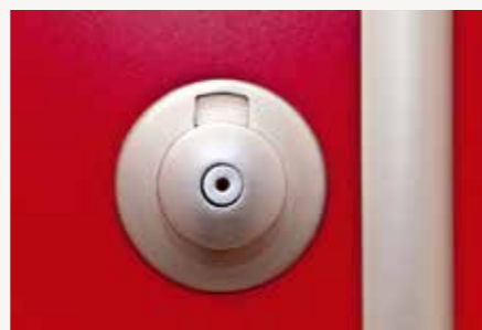
Notentriegelung mittels Inbusschlüssel möglich