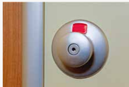
Einhand Knopfgarnitur mit Frei-Besetzt-Anzeige