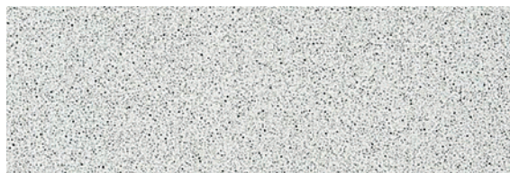
weiss punto 0558